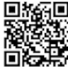
ちょめキューブ紹介ページ

https://production-simplespeaker.amebaownd.com