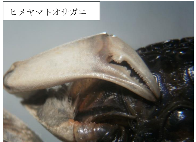
ヒメヤマトオサガニ