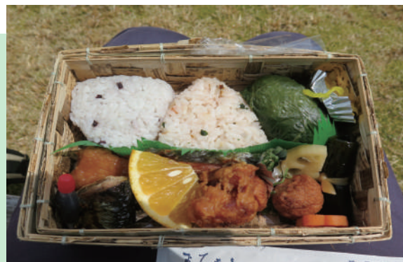
地元食材を利用したお弁当 (一例)