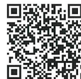
事前参加登録専用 ホームページ

https://www.pref.wakayama.lg.jp/prefg/070100/070109/smart/d00205193.html