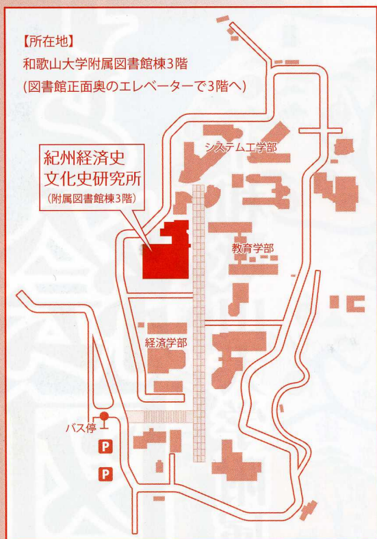
キャンパス内案内地図